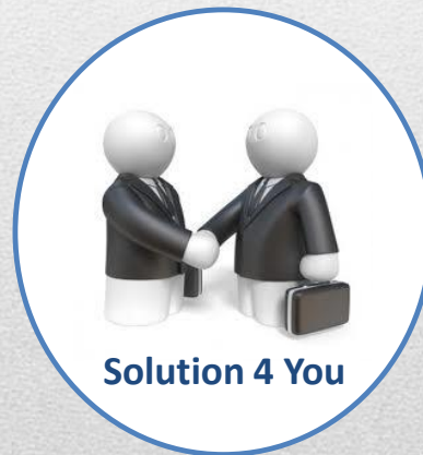
Solution 4 You